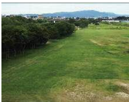
矢作川河岸と猿投山