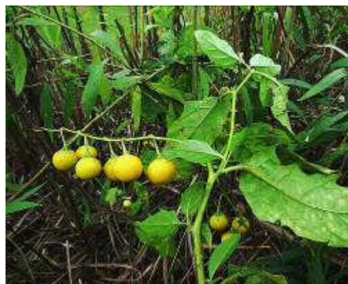
ワルナスビの果実