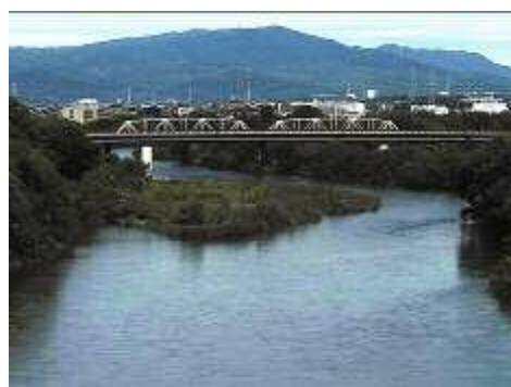
矢作川・工事中の新高橋・猿投山