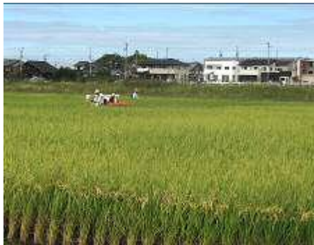
うるち米の稲田で稲刈り始まる

収穫間近の稲田の農道を経て、豊田大橋を渡り対岸を散策後、久澄橋を渡って戻る散策コースで、出会った身近な自然です。9月30日に新高橋の片側が完成し通行できる準備が進んでいます。