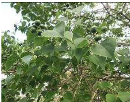
ナンキンハゼに果実が