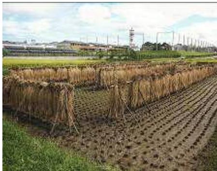
稲刈り後のもち米稲わら乾燥中