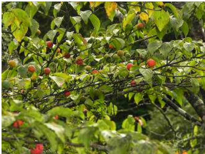
ヤマボウシの果実

松平東照宮周囲の堀では、藻が生い茂る中でギンヤンマが産卵中でした。その姿をトノサマガエルが見守っていました。他方の堀では錦鯉が餌を求めて群がっていました。