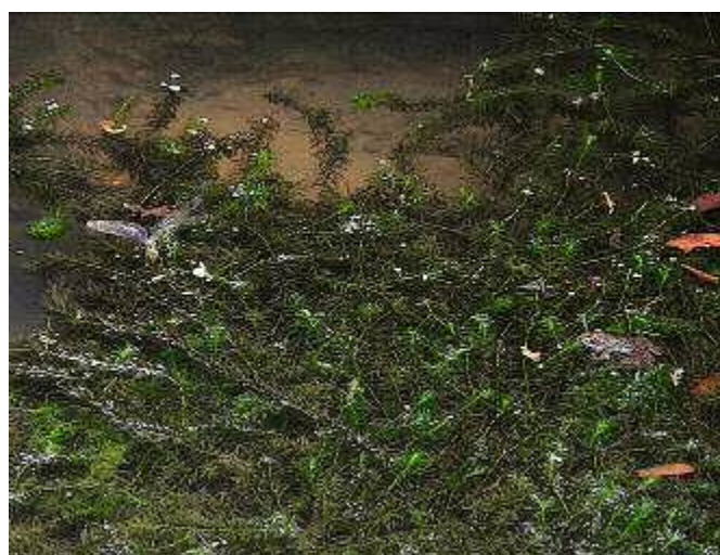
ギンヤンマとトノサマガエル