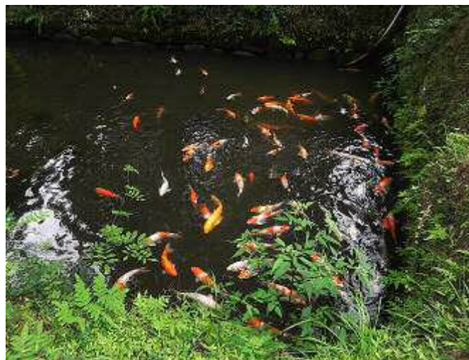
東照宮の堀のコイ