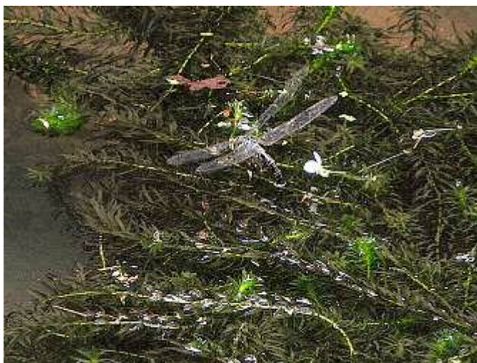
ギンヤンマ産卵中②