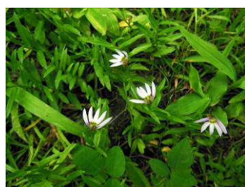
ミゾカクシ (アゼムシロ)