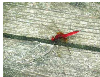
ショウジョウトンボ