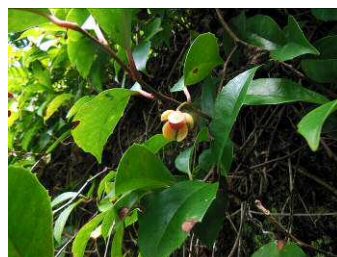
ビナンカズラ (サネカズラ)