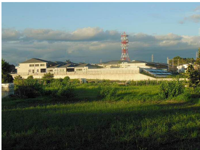
寺部こども園と寺部小学校