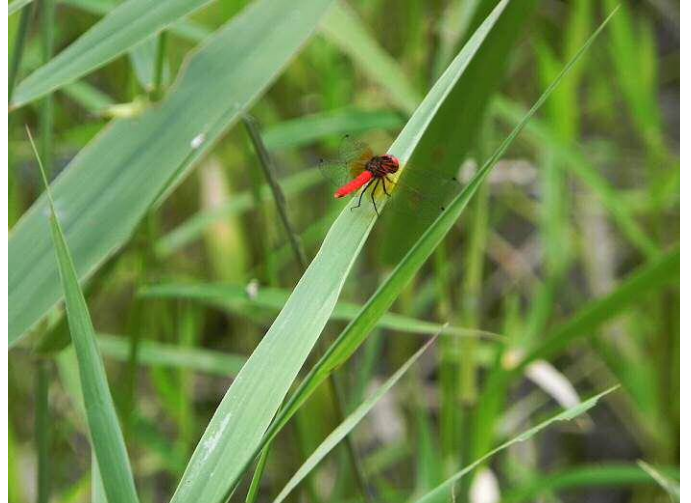
雄のハッチョウトンボ