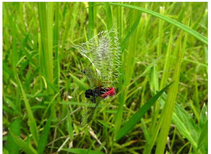
クモの巣に捕らえられた雄のトンボ