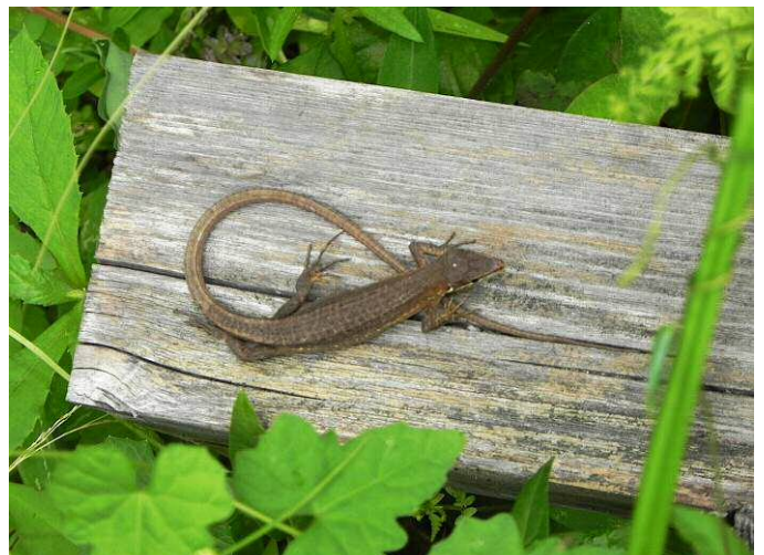
カナヘビにも出合った