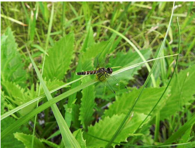
雌のハッチョウトンボ