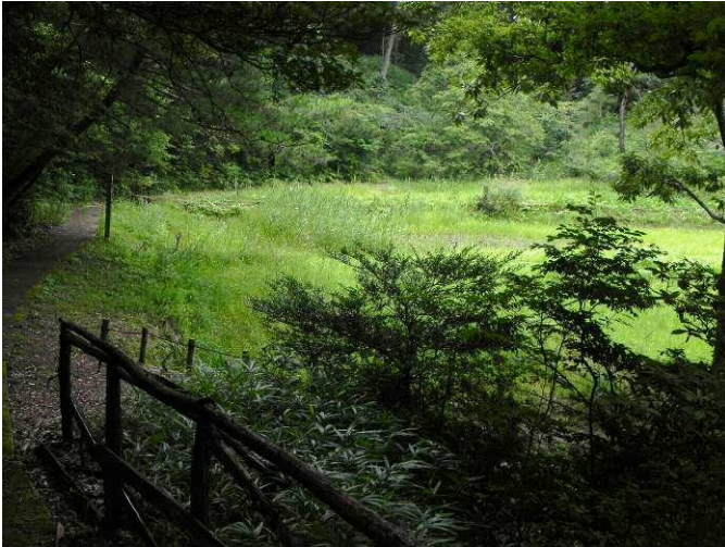
フォレスタヒルズの湿地

ハッチョウトンボは保護の対象となっている湿地特有の日本一小さいトンボです。体長は 1.7 cmほどで、1円玉の中に頭から腹端までが収まるほどの大きさです。フォレスタヒルズ湿地では、毎年5月から7月頃にかけて多数のハッチョウトンボが飛び交うところが観察できます。