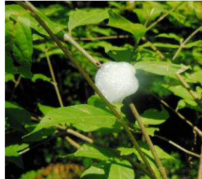
アワフキムシの泡