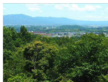
展望台より 北方向