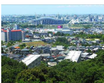
展望台より 西方向