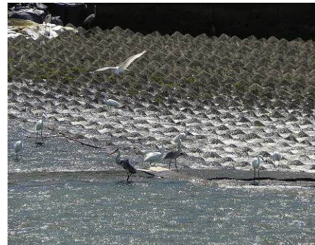
ダイサギやアオサギの群