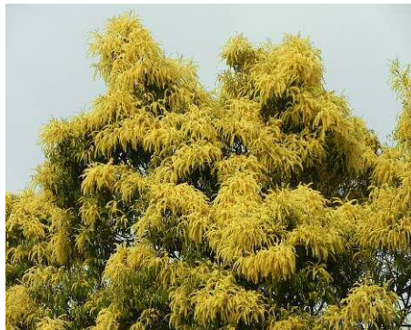
スダジイの開花最盛期