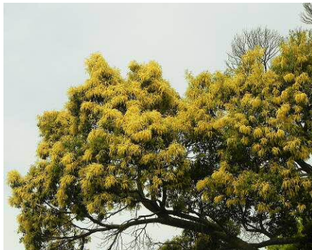
スダジイの木に花が

5月に入りお宮のシイの樹に花が一面に咲き、樹木の色が淡い黄色一色になってきました。散歩道沿いのアヤメも今が開花最盛期ですし、キジやウシガエルの鳴き声があちこちで聞こえる季節となりました。