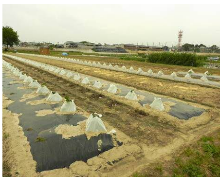
カボチャの苗成長中