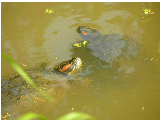
ミシシippアカミミガメ