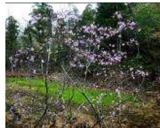
湿地に生育するシデコブシに花が