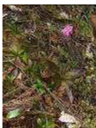
ショウジョウバカマ