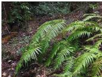
山際ではウラジロの新葉が出始めている

ラムサール条約湿地の一つとして矢並湿地、上高湿地と共に指定された恩真寺の先にある湿地です。シデコブシの花が湿地の端で迎えてくれました。湿地内ではハルリンドウの花やモウセンゴケが目につきました。