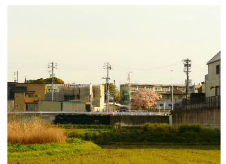
寺部こども園跡の桜も満開