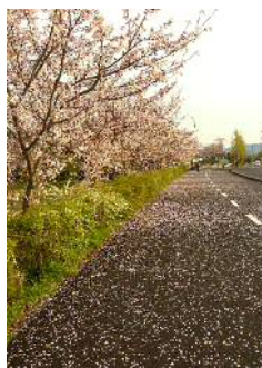
花びらのじゅうたん