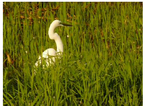
ダイサギの口ばしが黒い夏鳥姿