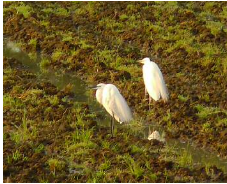
口ばしが黒い夏鳥の姿も