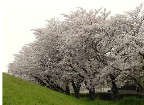
矢作川堤防下の安永川沿いの桜並木は満開