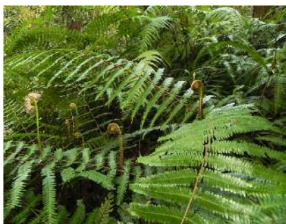
ウラジロに新葉が