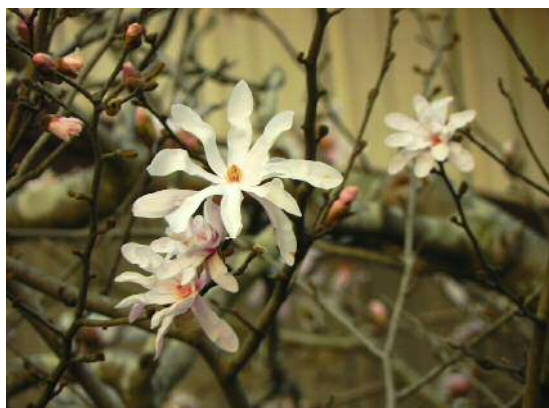
我が家のシデコブシ