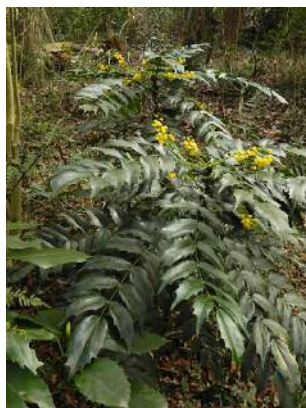
ヒイラギナンテン