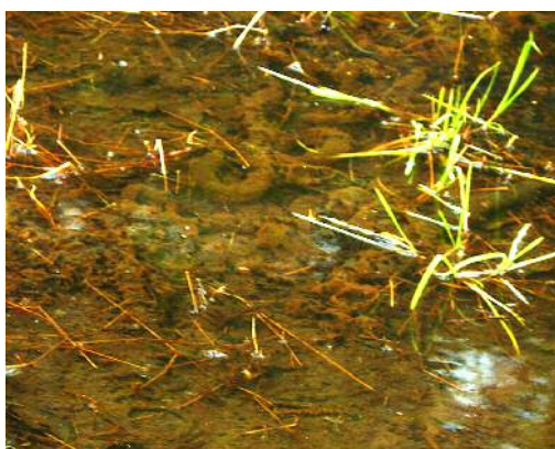
アズマヒキガエルの卵塊