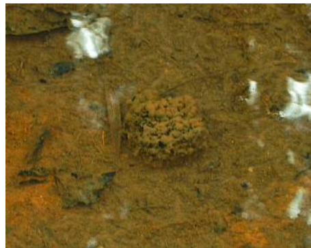
ニホンアカガエルの卵塊