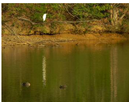
上池のダイサギとカルガモ