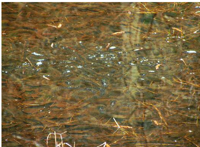
アズマヒキガエルの卵塊