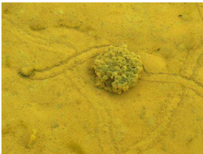
孵化間近のニホンアカガエルの卵塊