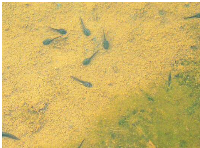
ニホンアカガエルのオタマジャクシ②