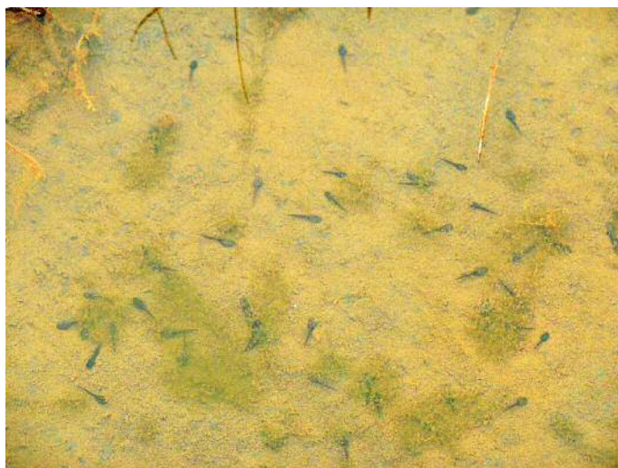
ニホンアカガエルのオタマジャクシ①