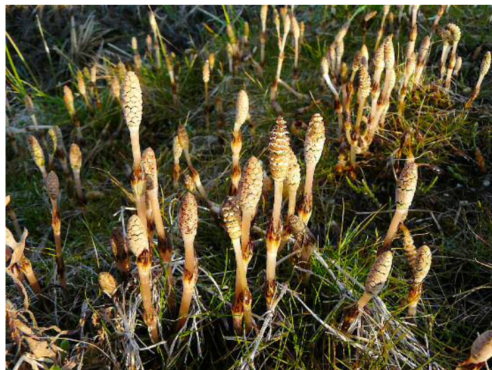
土手一面のツクシ