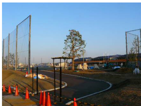
南門側からの新寺部小建設現場