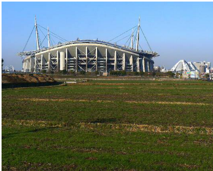
東側からの豊田スタジアム

早朝はまだまだ寒いけれども、身近な自然は着実に春めいてきています。ツクシは最盛期のようです。新設中の寺部小学校は最終段階に来ているようで、グラウンド一面整備されまっ平らです。