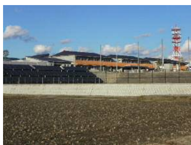
完成間近の寺部小①