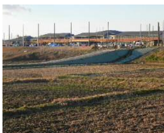
完成間近の寺部小②