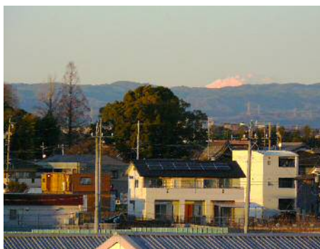
遠くに木曽の御岳山が