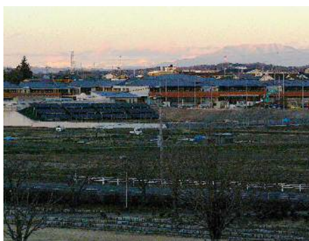
南アルプスと恵那山