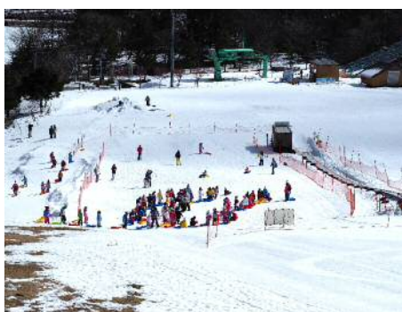
茶臼山高原スキー場