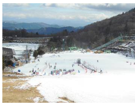
茶臼山高原スキー場