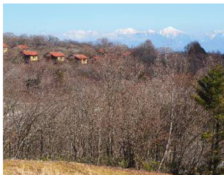
遠方には南アルプス連峰が