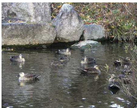
カルガモとコガモ