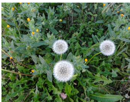
セイヨウタンポポ