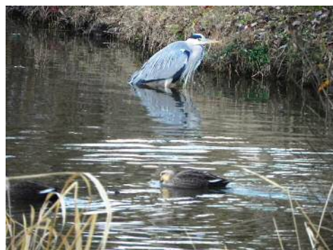
アオサギとカルガモ