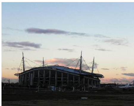
日の出前の西の空

日の出直前に家を出て身近な自然をカメラに収めました。修景池にはカルガモ、アオサギ、コサギなどの野鳥が群がっていました。昨日まで温かい日が続いたからなのか、ボケの花が数輪咲いていました。