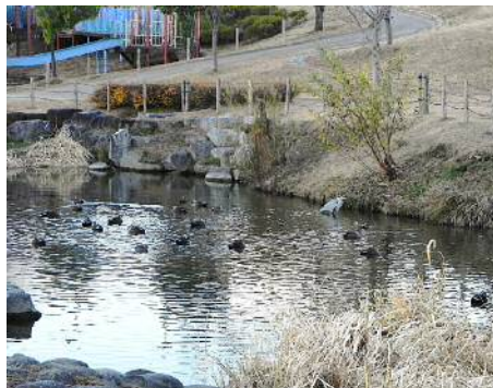
修景池の野鳥の群