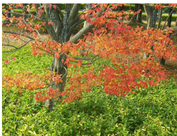
豊田市猿投運動公園の紅葉