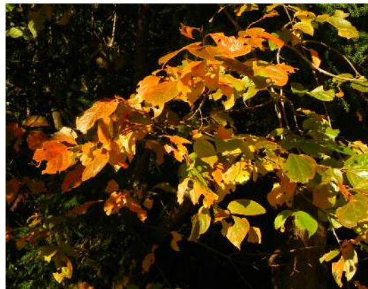
紅葉真っ盛りの柿の葉