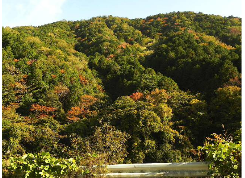
矢作川対岸の山は紅葉が始まっている