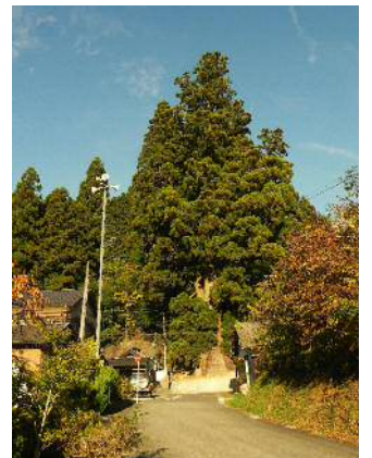
県下最大の杉本の貞観杉