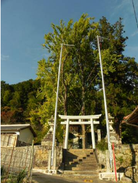
上川口の大イチョウ

豊田市の矢作川上流の紅葉の進行状況を観るために車を走らせました。樹の種類によっては紅葉が進行していました。11月中旬くらいに最盛期となるか？