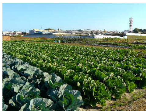
キャベツと白菜の畑