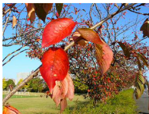
紅葉が美しい桜の葉