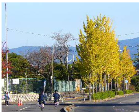
豊田北高東のイチョウ並木