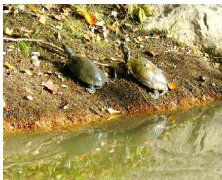
アカミミガメの甲羅干し