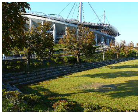
朝日を浴びるトチノキの影