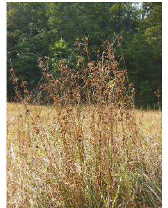
コマツカサススキ