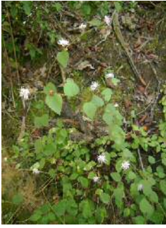
コウヤボウキ開花中

自然観察の森の上池ではアオサギやマガモが羽を休めていました。数日前にはオシドリも立ち寄ったと聞いています。トンボの湿地は湿地植物の最盛期は過ぎ一面褐色となり、湿地のあちらこちらの土手にイノシシがミミズを掘った後が見られました。