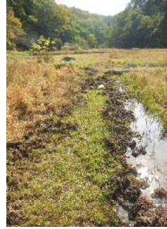
イノシシが湿地の土手を荒らす