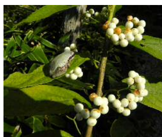
ニホンアマガエルが！