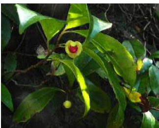
ビナンカズラの雄花