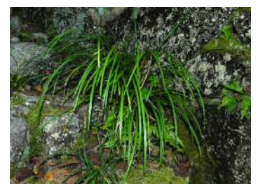
ヤブランに果実が