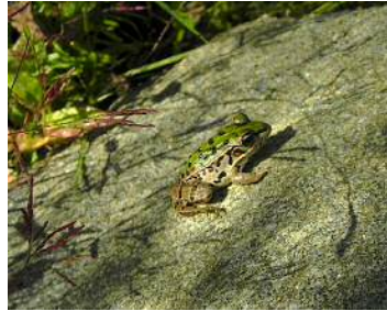
トノサマガエル幼体