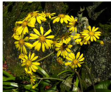
ツワブキの花に蜂が（何蜂？）