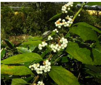
シロミノコムラサキ