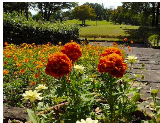
県緑化センター本館前