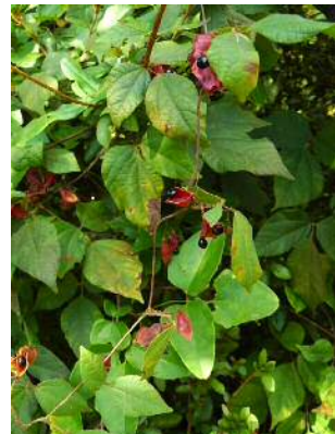
トキリマメの果実