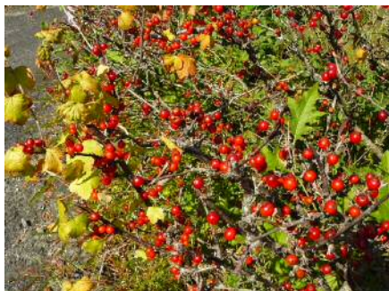
ヤブサンザシの果実

雲一つない青空の下、県緑化センターを40分ほど散策しました。秋の気配を教えてくれる様々な植物に出会うことができました。