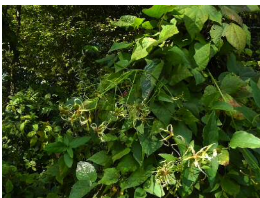
センニンソウの果実