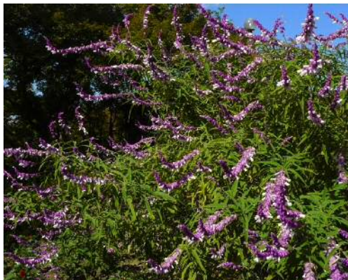
アメジストセージ