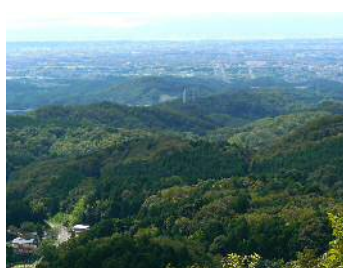
松平郷展望テラスから豊田市街も名古屋駅前ビルも