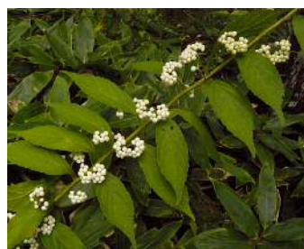
シロミノコムラサキ