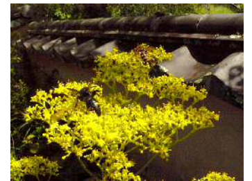
オミナエシに蜂が