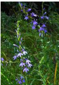
サワギキョウ 谷川の水量多し