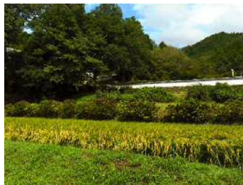
高月院の参道と稻田