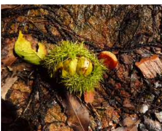
強風で落ちた山栗の果実