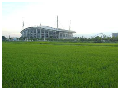
水田は順調に成育中