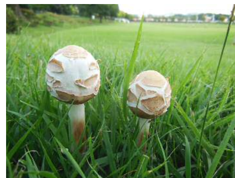
オオシロカラカサタケの幼菌