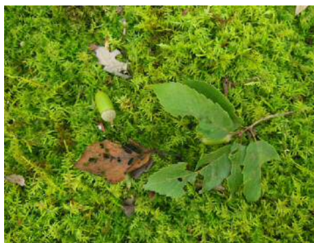
強風で落ちたコナラの果実