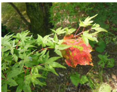
楓の枝に他の木の色づいた葉が