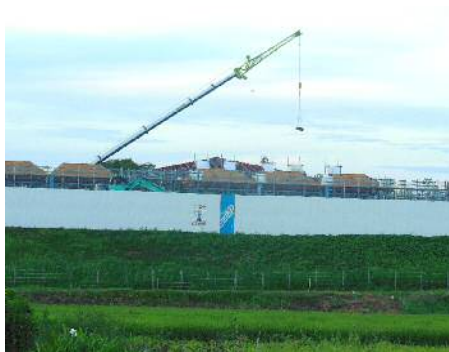
新寺部小の校舎屋根を建築中