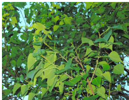
ナンキンハゼに若い果実が