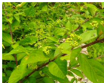
コムラサキシキブ