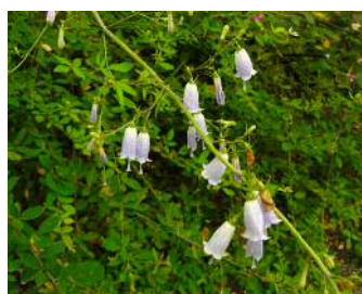
ツリガネニンジン