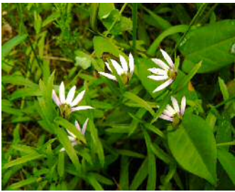
ミゾカクシ (別名：アゼムシロ)

池や湿地、谷川の水際を歩いていると、あちこちでカエルが飛び跳ねて水に飛び込む姿に出会いました。谷川ではツチガエル、池や湿地ではトノサマガエルによく出会いカメラのよき被写体でした。