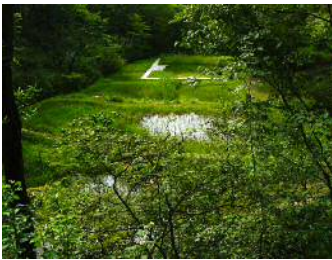
ホレスタヒルズ湿地

36℃を超える猛暑の午後、ホレスタヒルズの湿地に出向きました。湿地の各所でハッチョウトンボに出会いました。1.5cmほどの小さな赤い雄が特に多く目に付きました。よく見れば、小さな虎模様の雌も見付き、どちらも近づいてカメラに収めることができました。 サギソウの花を一つだけ見つけましたが、蕾もいくつか見付きましたので、今後さらに数多く咲き出すものと思います。