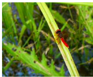
ハッチョウトンボ 雄④