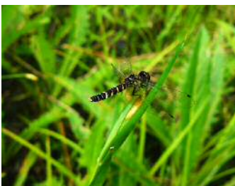
ハッチョウトンボ 雌 ①