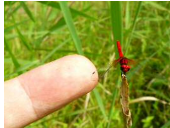
ハッチョウトンボ 雄①