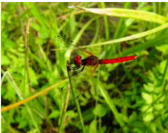
ハッチョウトンボ 雄③