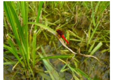
ハッチョウトンボ 雄⑥