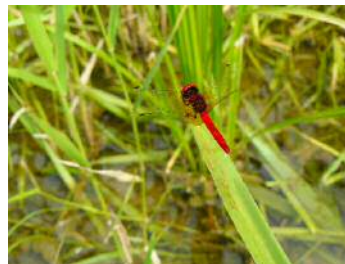
ハッチョウトンボ 雄⑤