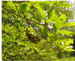
シデコブシノ果実