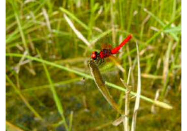
ハッチョウトンボ 雄②