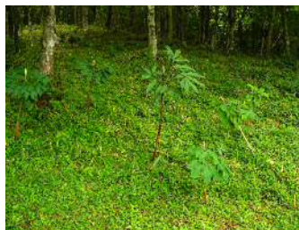
マムシグサに果実が