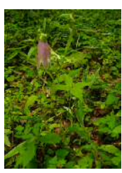
ホタルブクロとツクバネソウ