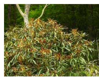
ホソバシャクナゲ