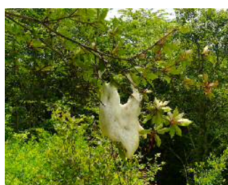
モリアオガエルの卵塊