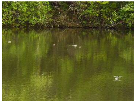
カイツブリとツバメ