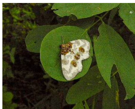
ユウマダラエダシャク