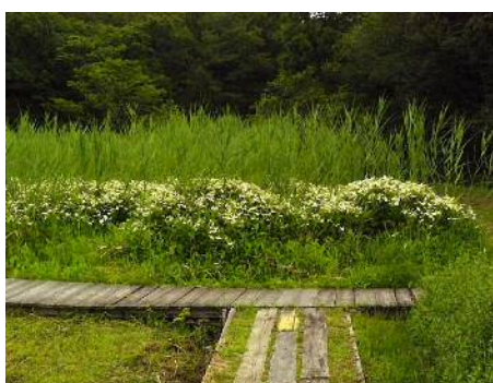
ハンゲショウ群落