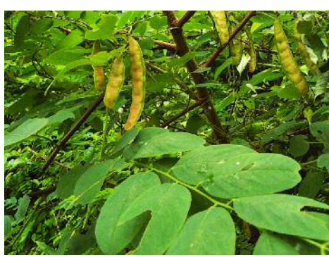
ハリエンジュの果実