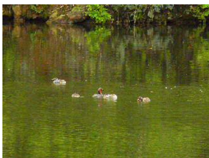
カイツブリの親子