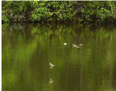
上池ではカイツブリの親子が