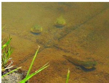
ウシガエルのオタマジャクシ