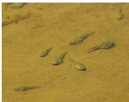
トノサマガエルのオタマジャクシ