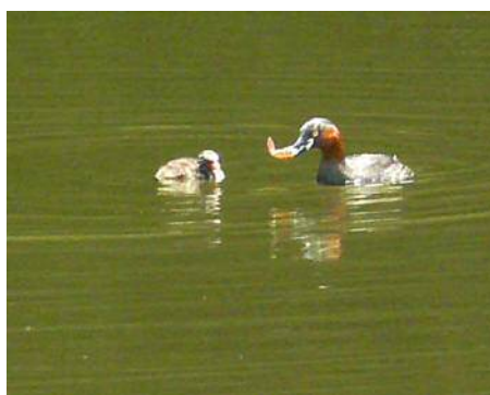
親が子に餌を与えていた