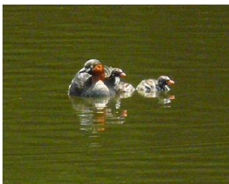
カイツブリの親子