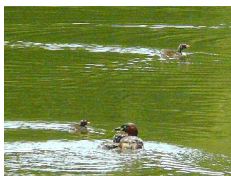
カイツブリの親子