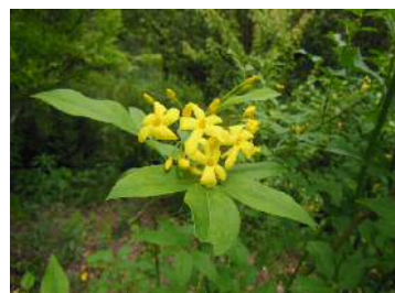
キンケイ（モクセイ科）