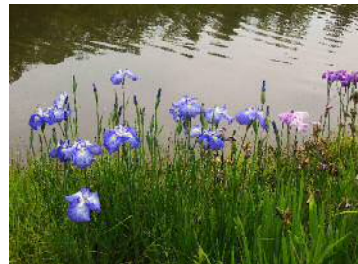
ハナショウブ各種