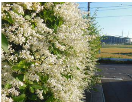
イボタノキ (モクセイ科)

日没時刻もかなり遅くなり夕方の6時頃といえどもまだ太陽は高い西の空にありました。雲一つない晴天のもと、スタジアム周囲を散策しました。