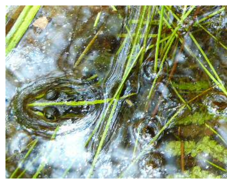
トノサマガエル 雄