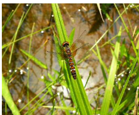
ハッチョウトンボ 雌②