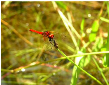
ハッチョウトンボ 雄③