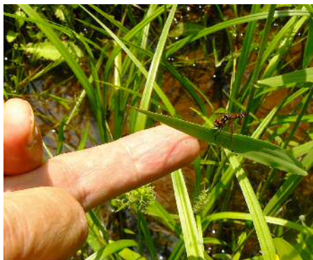
ハッチョウトンボ 雌①