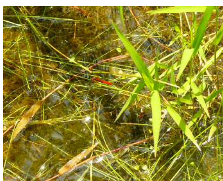
ハッチョウトンボ 雄②