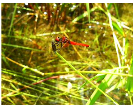
ハッチョウトンボ 雄④