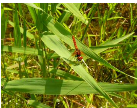
ハッチョウトンボ 雄①