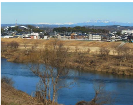
矢作川と遠景の南アルプス・恵那山