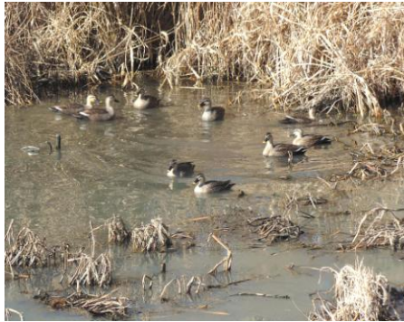
修景池のカルガモの群