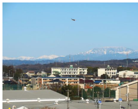
南アルプスと恵那山