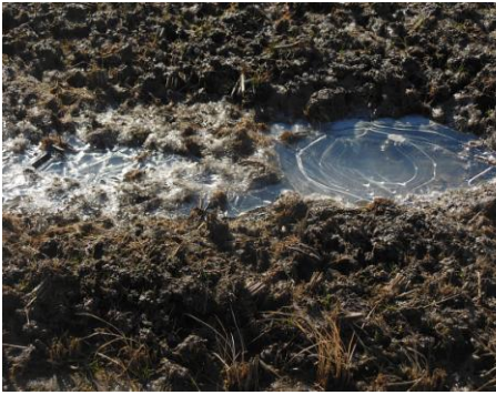
水田の水たまりは凍っていた

最近では一番の空気の澄んだ晴天の日でした。我が家から豊田スタジアム北の修景池、豊田大橋までの散歩コースで、思わずカメラを向けたくなる感動の自然や光景にいっぱい出会いました。