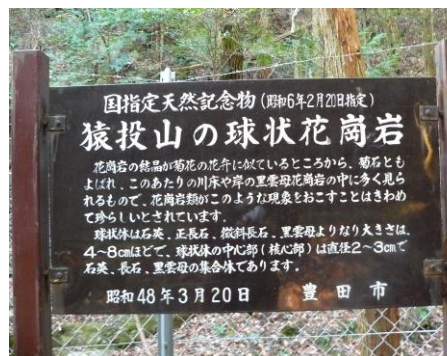
天然記念物指定の猿投山の球状花崗岩（菊石）案内