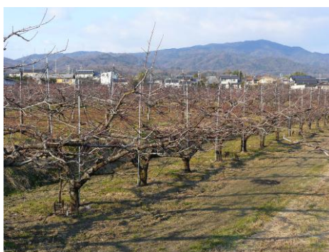
猿投山麓の桃の果樹園