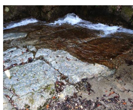
菊の文様が見られる球状花崗岩（菊石）の河床