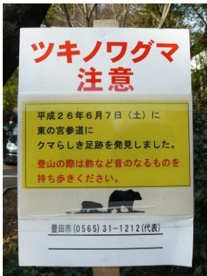
クマが出没することもある！