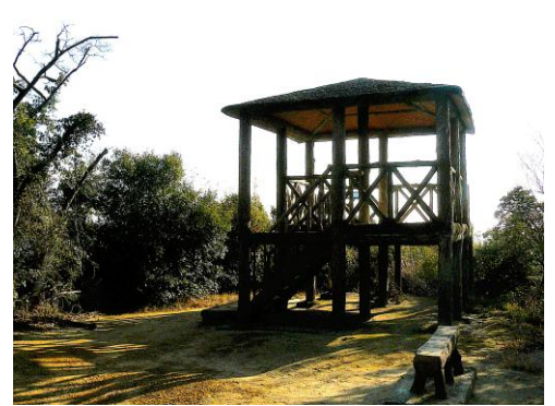
猿投山中腹の展望台