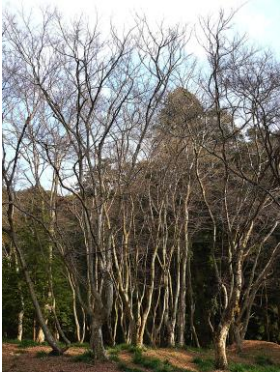
東昌寺大悲殿前の紅葉林の冬の姿

新たな年を迎え、久々に猿投山方面に出向きました。猿投神社はまだ初詣の人もありにぎわっていましたが、冬の猿投山中は東海自然歩道を散策している人に時々出会うくらいでとても静かでした。