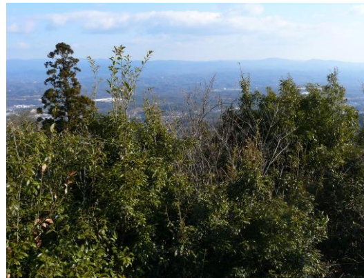
中腹の展望台から南東方面を望む