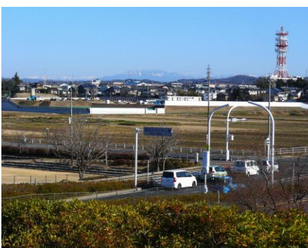
南アルプスと恵那山