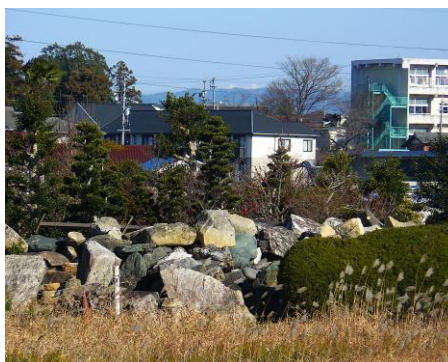
寺部小学校の左背景には御岳山が