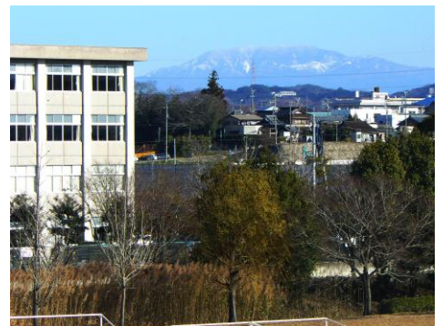
豊田北高校の背景には恵那山が