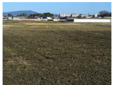
寺部小学校移転新築現場と猿投山