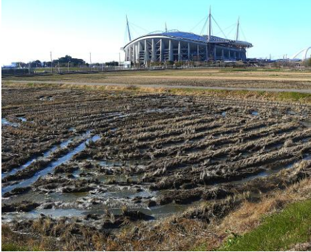
氷が張っている水田

遠方には、恵那山や南アルプス、御岳山などの雪をかぶった白い姿が見えカメラに収まりました。