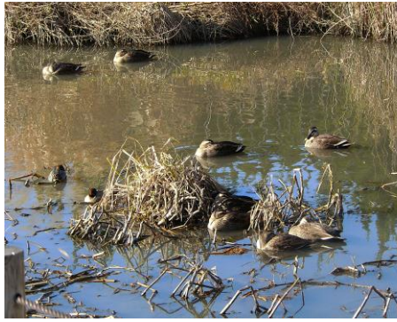
カルガモとコガモ