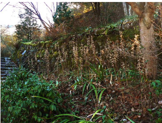
枯れ残っているギボウシの花穂