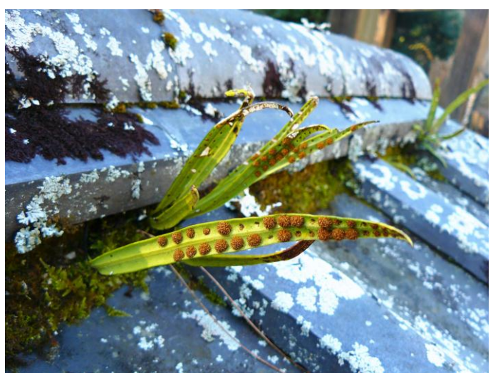
ノキシノブの葉裏には胞子のうがいっぱい