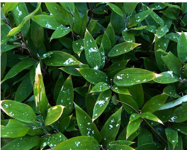
葉の上にわずかに雪が残っていた