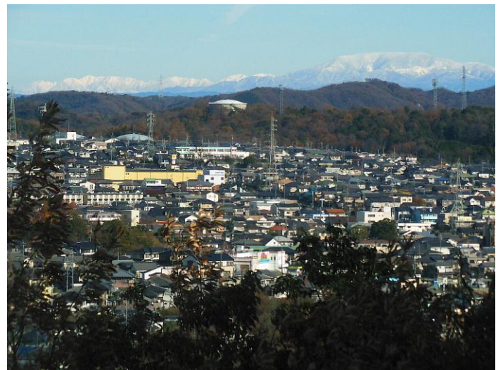
南アルプスと恵那山