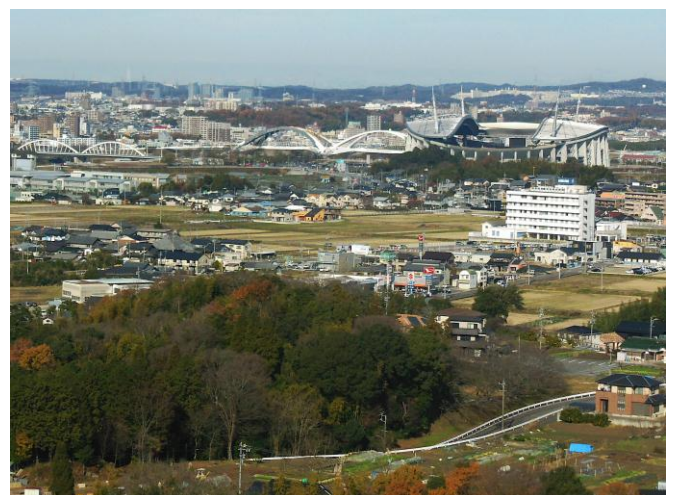
豊田大橋と豊田スタジアム