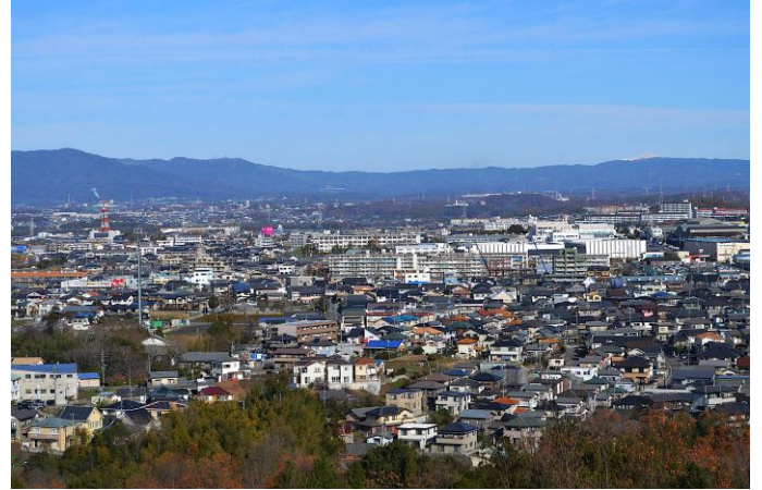
豊田市の北部山地方面