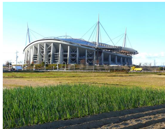
ネギ畑と豊田スタジアム