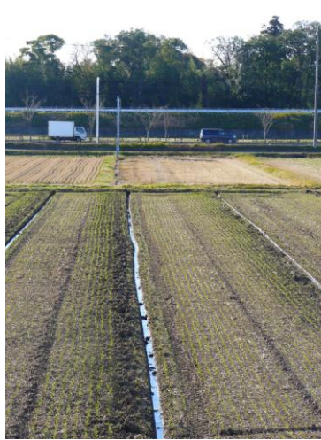
麦が発芽し生長中