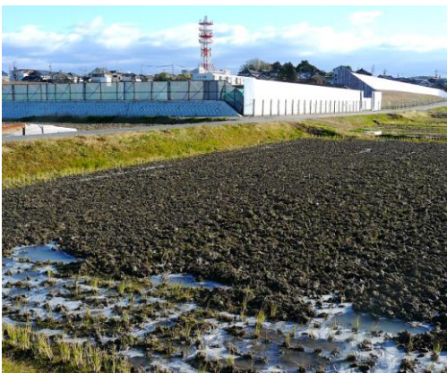
寺部小学校の移転建築工事進行中