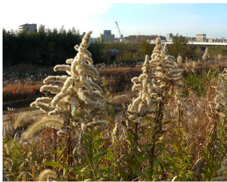
セイタカアワダチソウ