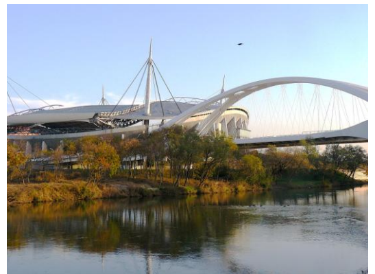
矢作川と豊田大橋・豊田スタジアム