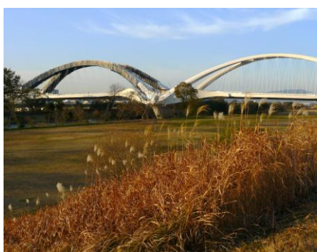
補強工事中の豊田大橋