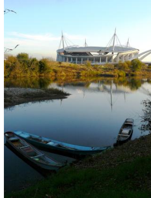
矢作川と豊田スタジアム