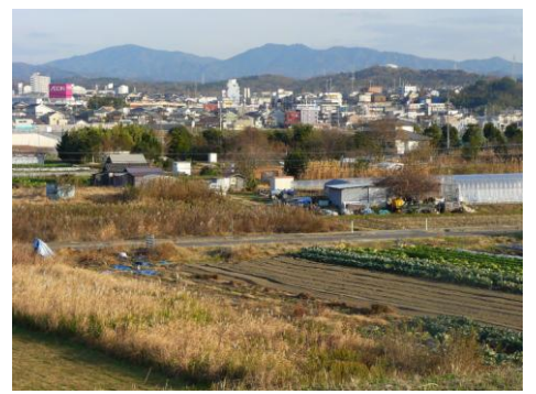
堤防から東方の景観