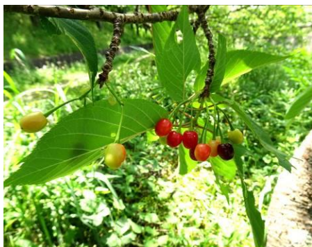
カワツザクラの果実