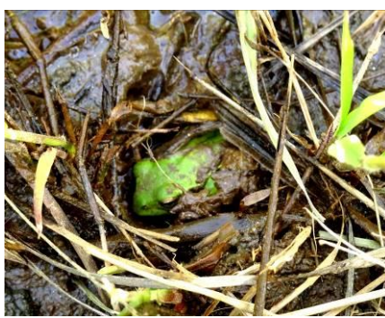
シュレーゲルアオガエル ♂