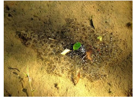
昨夜産卵のトノサマガエルの卵塊