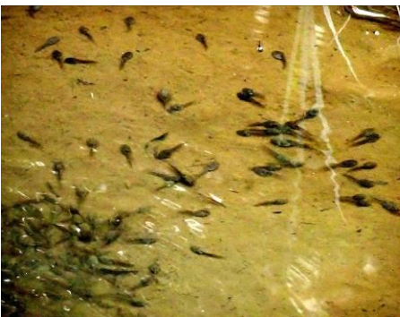
ニホンアカガエルのオタマジャクシ