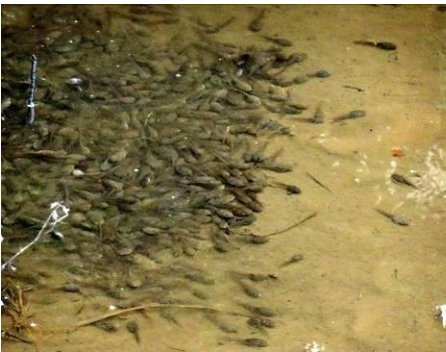
孵化後成長中のニホンアカガエル