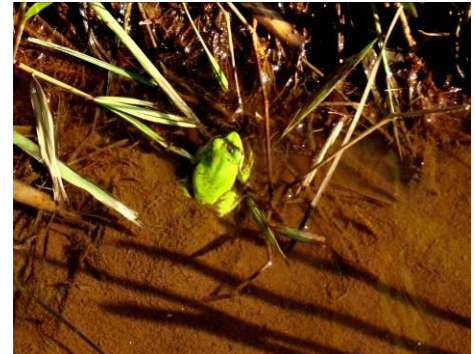
シュレーゲルアオガエル