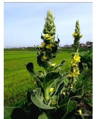
ビロードモウズイカ