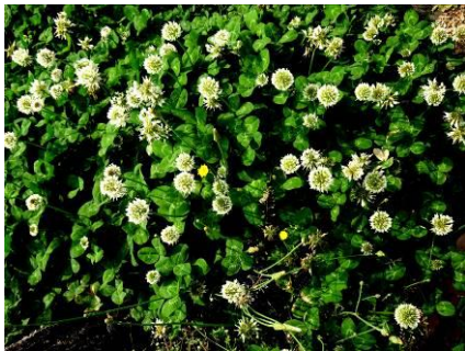
シロツメクサ (マメ科)