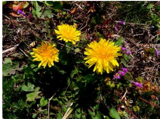
セイヨウタンポポ