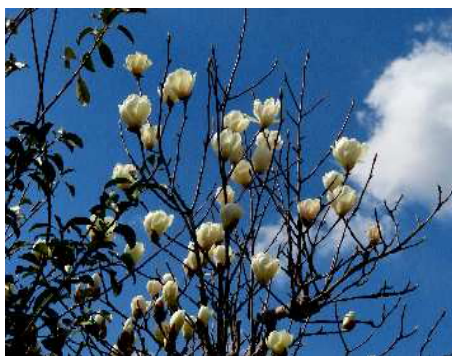
12時47分 ハクモクレン