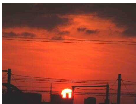
21日 17:29 日没