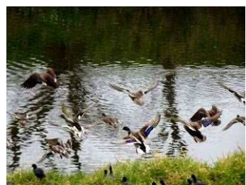
飛び立つカルガモ