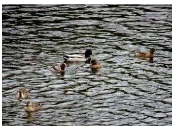
カルガモ マガモ コガモ