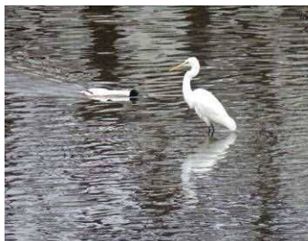
ダイサギとカワアイサ