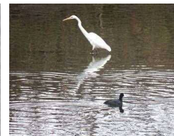
ダイサギとオオバン