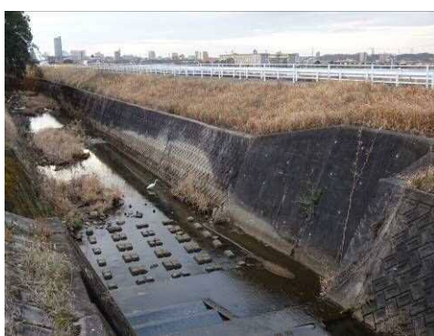
加茂川にダイサギが！