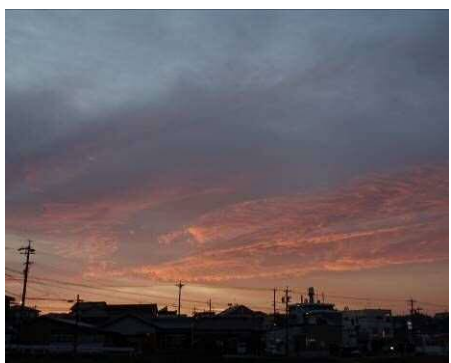
14日 日の出前の朝焼け