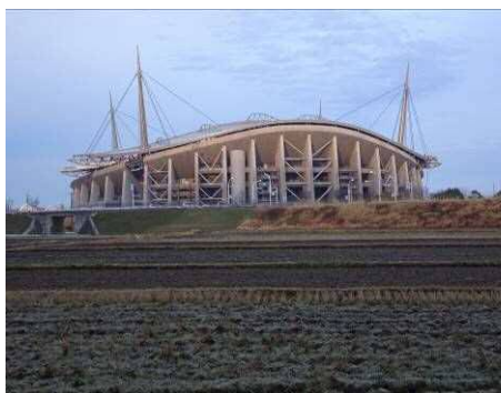
朝日を浴びるスタジアム