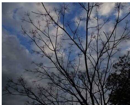
果実が落ちて無くなったセンダン