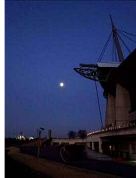
6 : 21