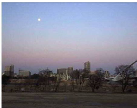
6 : 38