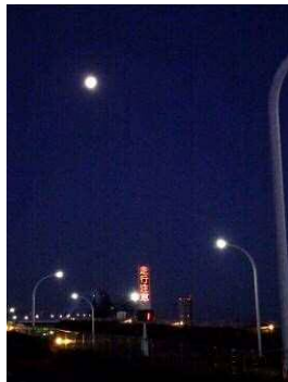
6 : 14 1℃