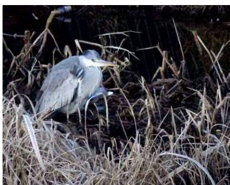
6 : 46 アオサギ