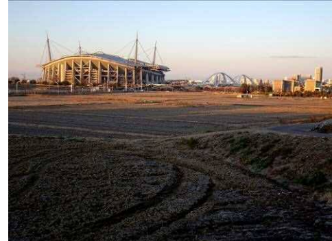
7 : 01