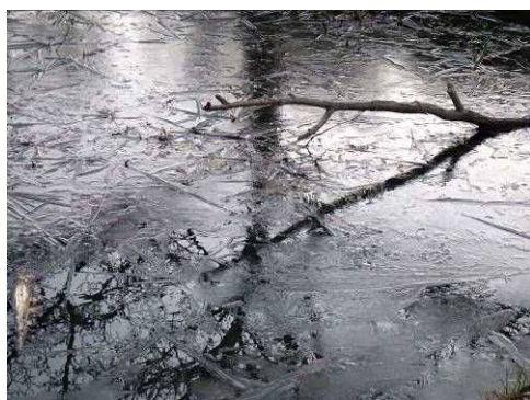
6 : 51 薄氷