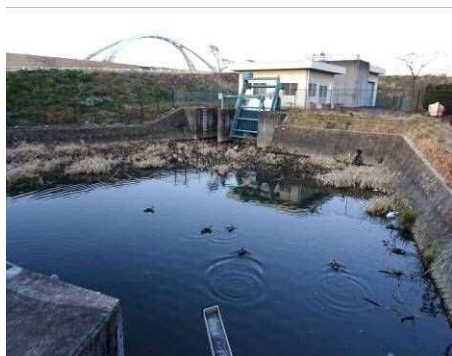
6 : 44 カルガモの群れ