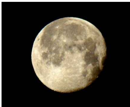
6 : 03 十七夜月

西の空高く十七夜の月が美しく輝いている早朝でした。今朝の日の出時刻は、炮烙山と六所山の間から6時55分頃でした。修景池では、カルガモ、アオサギ、カワセミに出会いました。