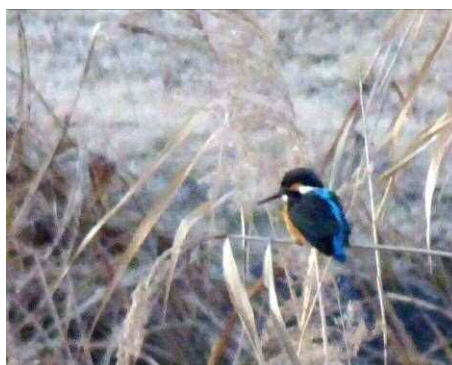
6 : 47 カワセミ