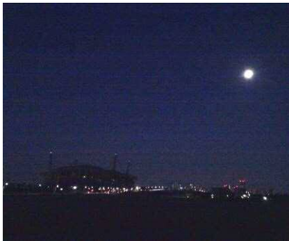
6 : 05