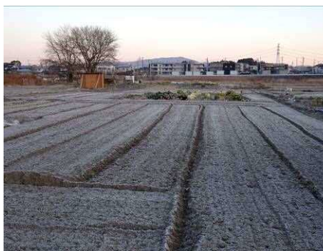
6 : 54 霜